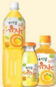
我的爱-柚子C 1.5L, 340ml/pet, 180ml/瓶