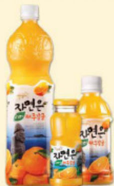
济州蜜橘 1.5L, 340ml/pet, 180ml/ 瓶