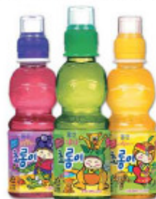
儿童饮料 1.5L, 200ml/pet