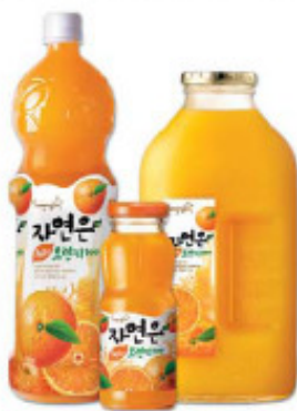
橙子 1.5L/pet, 180ml/ 瓶