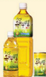
玉米须茶 1.5L, 500ml/pet, 240ml/罐