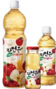
苹果 1.5L/pet, 180ml/ 瓶