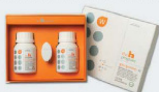
Plus Multi Vitamin W