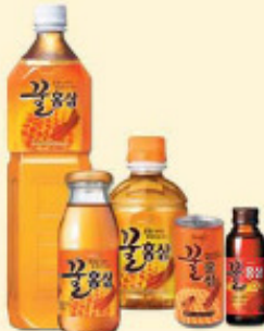
蜂蜜红参 1.5L, 280ml/pet, 180ml/瓶, 190ml/罐