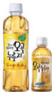
五谷锅巴茶 500ml, 340ml/pet