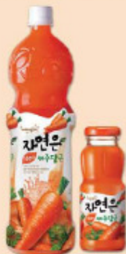
胡萝卜 1.5L/pet, 180ml/ 瓶