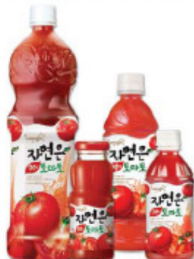
番茄 1.5L, 340ml/pet, 180ml/ 瓶