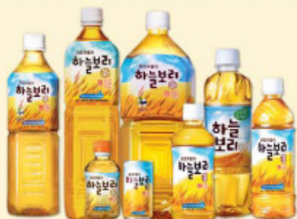
蓝天大麦茶 2L, 1.5L, 500ml, 320ml/pet, 180ml/罐