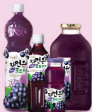
葡萄 1.5L/pet, 180ml/ 瓶