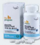
CHEWABLE Calcium Plus D