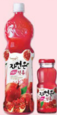
石榴 1.5L/pet, 180ml/ 瓶